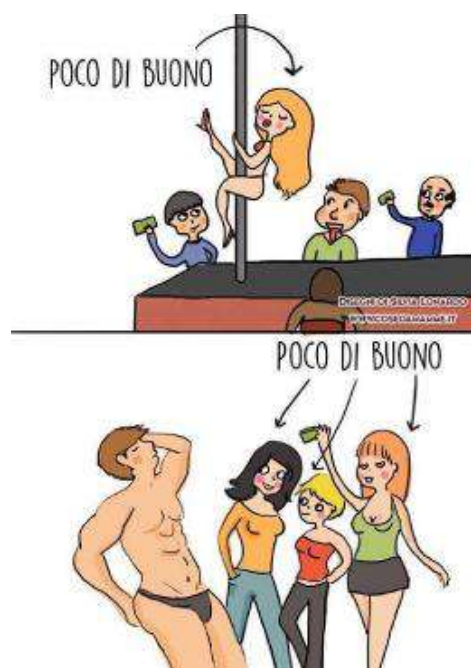
Immagine 2 La doppia morale - Slide Grazia Priulla pag. 25 - 16/05/19